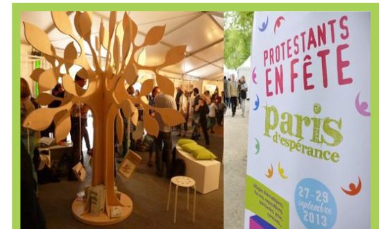
Septembre 2013, les protestants unis à Paris pour la grande fête.

Dieu change à Paris : les recompositions contemporaines du protestantisme parisien. Sébastien Fath