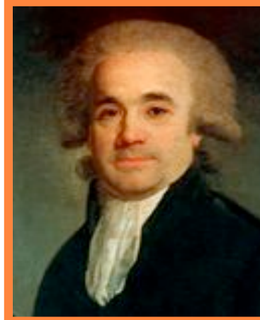
Portrait de Jean-Paul Rabaut Saint-Etienne (1743-1793), 18 e siècle, anonyme