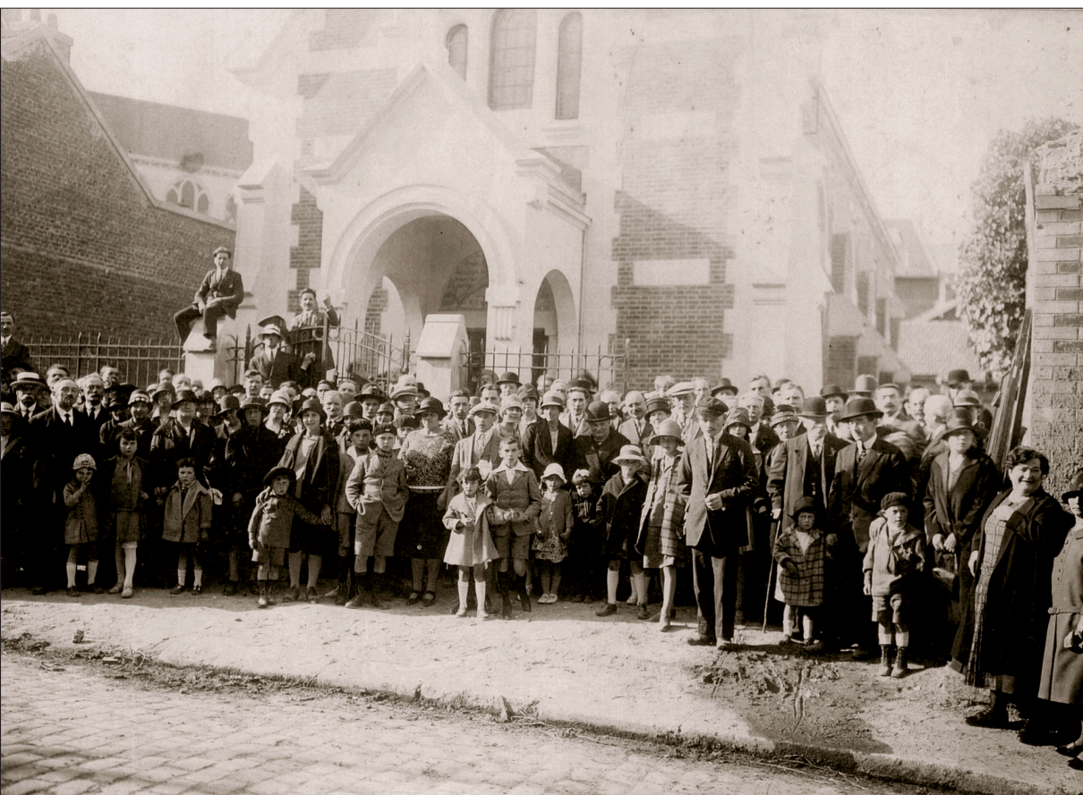
Inauguration du nouveau temple baptiste de Chauny en mai 1927.

et de La Fère ont eu tendance à baisser légèrement, et aucune autre Église baptiste n'a dans l'intervalle été créée en Picardie. L'Amiénois, à cette date, reste encore vierge d'Église évangélique de cette confession. Pour les pasteurs baptistes de la première moitié du XX e siècle, le pain blanc du réveil, savouré par leurs prédécesseurs de la première moitié du XIX e siècle, laisse place au pain gris ou noir de la routine et des misères de la guerre : à La Fère comme à Chauny, les temples furent partiellement détruits en 1917, nécessitant de longues années de reconstruction.