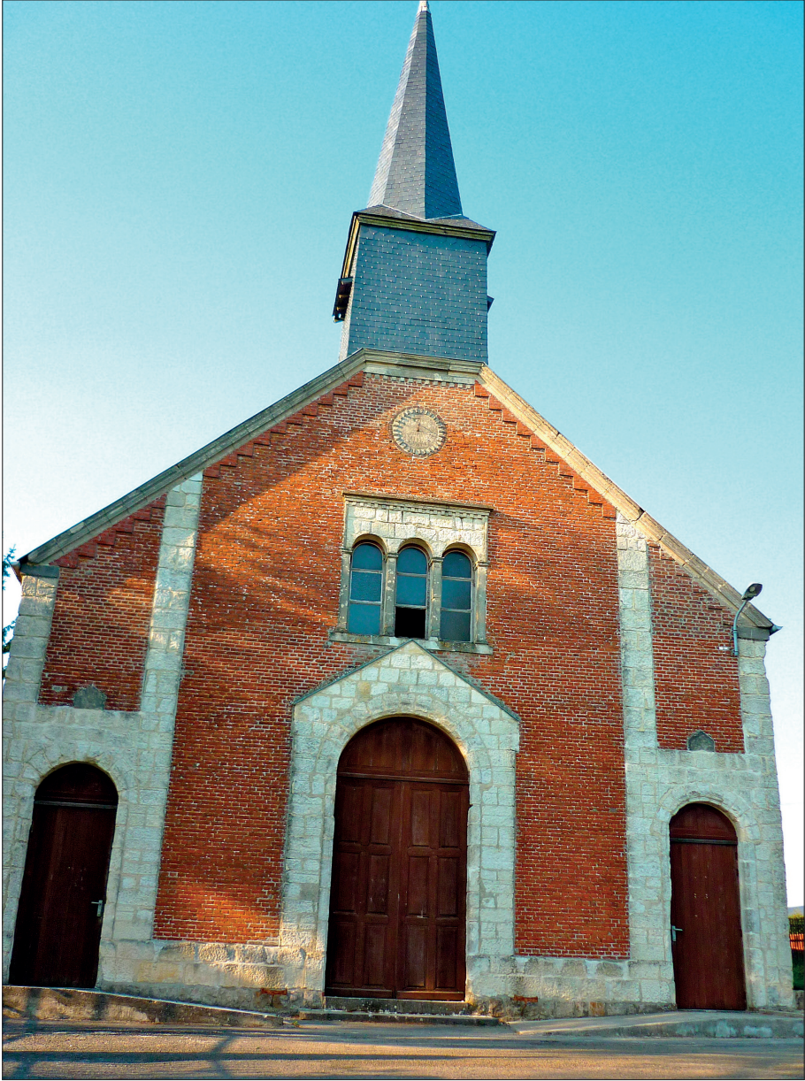
Le temple-musée de Lemé.